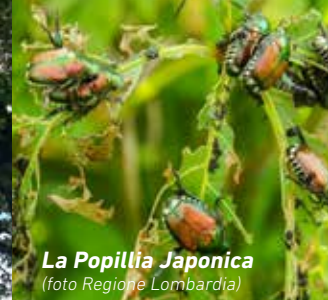
La Popillia Japonica

dotti a bassissimo impatto ambientale, una volta che le uova si sono schiuse, per ridurre la vitalità delle neanidi (l'insetto nello stadio giovanile).