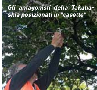
Gli antagonisti della Takahashia posizionati in "cassette"

Interessate 50 piante: 5 gelsi in via Pellico a Velasca e 10 liquidambar in via Cremanani. La seconda fase, eseguita in giugno, prevede il lavaggio dei rami con pro-